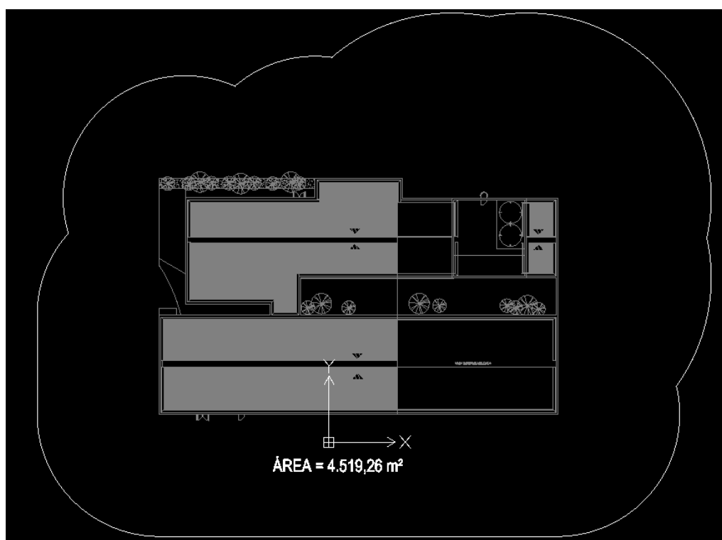
Figura 2 – Área de exposição equivalente ( A_D )

Por se tratar de estrutura complexa, a área de exposição equivalente ( A_D ), definida pela intersecção entre a superfície do solo com uma linha reta de inclinação 1 para 3 a qual passa pelas partes mais altas da estrutura (tocando-a nestes pontos) e rotacionando ao redor dela, foi definida graficamente e está representada pela área hachurada na Figura 2.